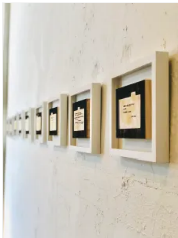
Imagen de la instalación de la obra de Sarah Francis Hollis en Mantle Art Space

Las obras de arte que se encuentran en An Incredible Weight/Wait examinan la destrucción causada por una relación violenta en el contexto del testimonio personal. Hay un diálogo poderoso entre los objetos poéticos de Hollis y las piezas de respuesta de Maupin. Su trabajo demuestra dos lados de una experiencia intensa, exponiendo el trauma personal de la violencia doméstica y procesando el testimonio de otros con empatía.