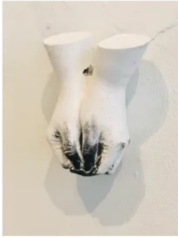
You Left Your Mark (ash dipped hands) by Taylor Maupin

piece serves as both a personal account and shout of support and reassurance for all those touched by gender-based violence and harassment.