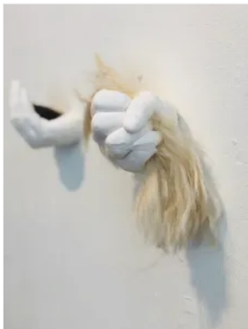
Him/Her (manos sosteniendo el pelo) hecho por Taylor Maupin

Grabado en la cara de estas losas de madera es una historia de dolor, desesperación, pero fundamentalmente, una decisión personal para elegir la propia seguridad al frente de la crueldad y la indiferencia. En un esfuerzo por desestigmatizar la violencia doméstica y amplificar las voces de los sobrevivientes de violencia doméstica, el poema de Hollis sirve como una cuenta personal y grito de apoyo y tranquilidad para todos aquellos afectados por la violencia y el acoso.